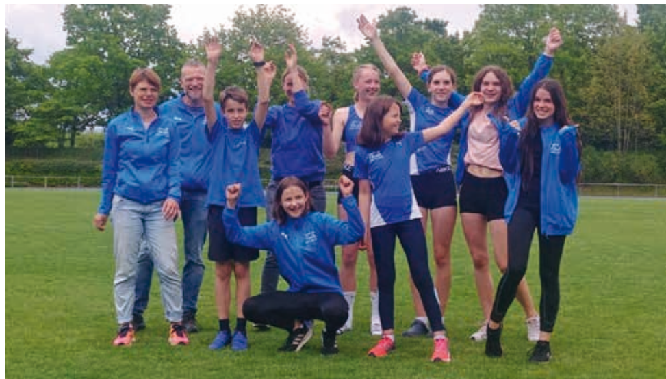
Höllsteins Truppe beim Mehrkampf in Rheinfelden (Pia fehlt leider auf dem Foto)

Für Interessierte hält die Internetseite ladv.de jeweils Ergebnisse und Ausschreibungen der einzelnen Wettkämpfe bereit.